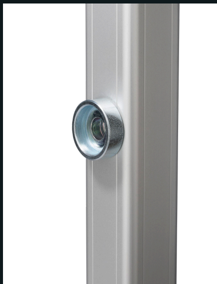
Standard Monoblox Rahmen